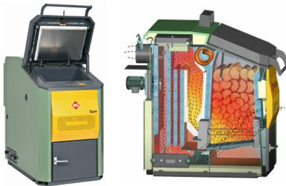
BU: Der HDG Euro – von außen und von innen.