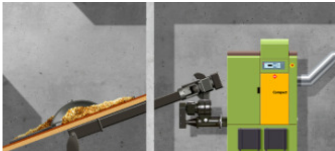
BU: Darstellung einer HDG Compact 25 mit Brennstofflager und Raumaustragung.